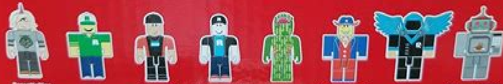
FreezeFishes Hypnot Roblox Staff Roblox Super Fan Sharkie Uncle Ben's Uncle Vasa Microverse Robot